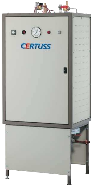
Elektro stoomproductie 8 - 97 kg/h

CERTUSS PARCOVAP® Warmteterugwinning uit condensaat